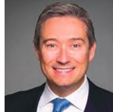
François-Philippe Champagne député libéral de la circonscription Saint-Maurice Champlain Ministre du Commerce international

La Classique fait partie des événements emblématiques de la Mauricie ! J'invite la population à prendre part à cette grande tradition et à venir encourager les canotiers tout au long du parcours de 200 km, sur notre belle rivière Saint-Maurice. La Classique, c'est aussi l'occasion de célébrer en famille et de profiter d'une programmation culturelle variée, qui saura plaire à tous !