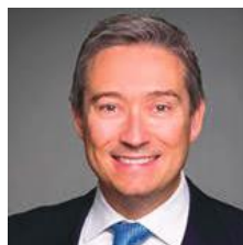
François-Philippe Champagne député libéral de la circonscription Saint-Maurice Champlain Ministre du Commerce international

La Classique fait partie des événements emblématiques de la Mauricie ! J'invite la population à prendre part à cette grande tradition et à venir encourager les canotiers tout au long du parcours de 200 km, sur notre belle rivière Saint-Maurice. La Classique, c'est aussi l'occasion de célébrer en famille et de profiter d'une programmation culturelle variée, qui saura plaire à tous !